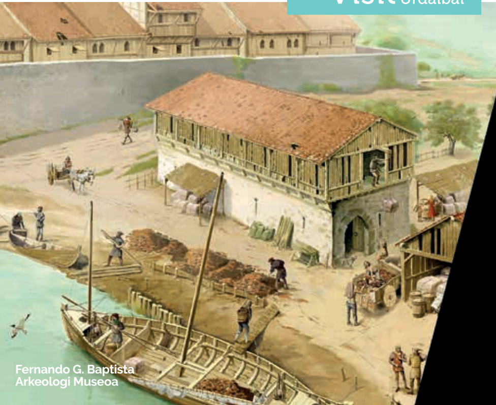
Arkeologi Museoa