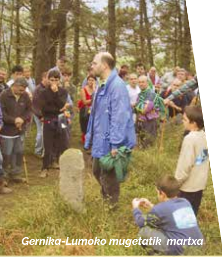
Gernika-Lumoko mugetatik martxa