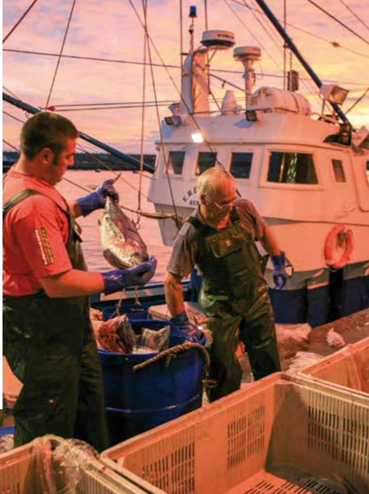
Arratzaleak Bermeoko portuan

2015eko maiatzaren langabeziaren datuak poztekoak dira, azken bi urteetan EAEko joera positiboa izan da, eta 2015erako iragarpenak be bai. Horrelako joera dauke eskualdean buru diren herri biek, Bermeo eta Gernika-Lumok eta Busturialdeak berak.