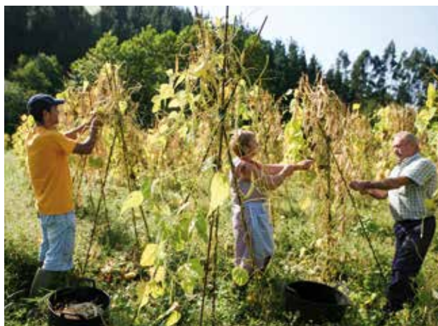
Nekazal esplotazioa Busturialdean

sektorean dago. Nekazaritzatik bizi diren profesional kopurua txikoagoa da ez dagoalako familiaren arteko erreleborik. Esplotazioak arrantza jarduera izan ezik, familiarrak dira. Dana dala, bere izateak eta baserri kulturak iraun dau eta esplotazio profesional barriak sortu dira, jauzi kualitativoa eman dabe; batez ere, ortufruitukulturan, txakoligintzan eta abeltzaintzan (behi okela eta esnea).