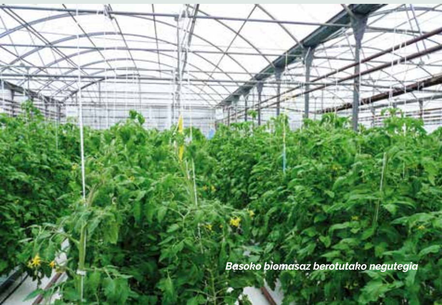
Basoko biomasaz berotutako negutegia

Biomasa nahiko merkea da eta gero eta erosoagoa. Lehen biomasan inbertitzeko arrazoiak ingurumenarekin euker zer ikusia, gaur egun alderdi ekonomikoa be kontuan izaten da. Ebepellet-en pelleta etxean erabiltzeko sortzen da. Ingurumen ziurtagiria dauken ikutubako egur plantazioetatik ateratzen dan zerrautsetik lortzen da %100. Holan, kontsumitzaileentzat kalitatezkoa da eta egurraren errentagarritasuna bermatzen dau, lehen balio erantsi gutxiagoa zuena.