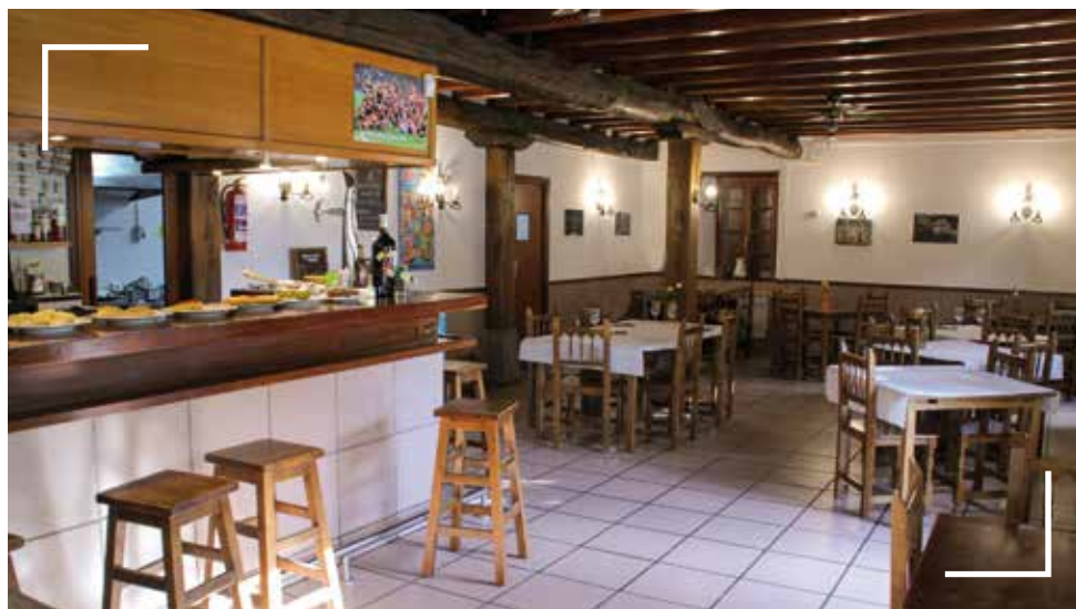
Arratzuko Herriko Taberna

G ogorrena neguan izaten da, zelan iraun. Horretarako Arratzuko Herriko Tabernak eskaintza zabala dauko: eguneroko menuak, asteburuko menuak, karta edo mota guztietako pintxoak barran. Gainera, aurretiaz esanda, Gabonetarako jatekoa prestatzen dau etxera eroateko.