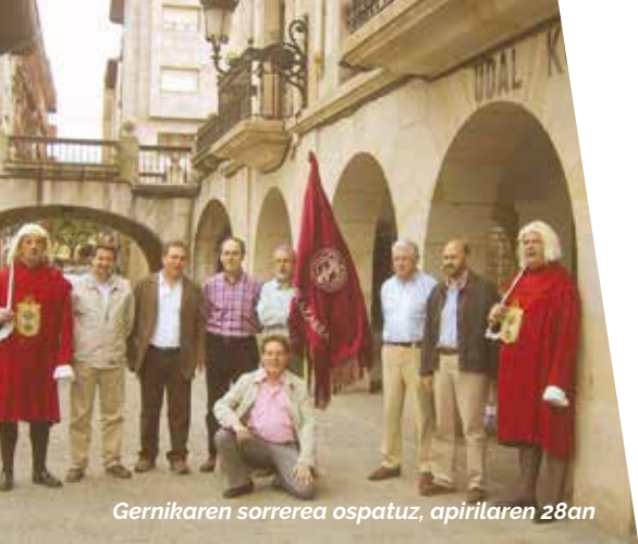
Gernikaren sorrerea ospatuz, apirilaren 28an