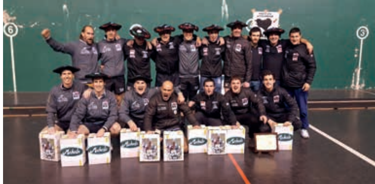
Murueta Euskal Herriko sokatira txapelkun, 680 kilotan (2017).

Murueta Sokatira Taldea 20 lagun osatzen dabe, 17 eta 50 urte bitartekoak. Adin tarte handi honi esker sokatiraren pisuko lau modalitate ezberdinetan parte hartzeko konbinazio ezberdinak egiteko aukera izan dabe: 680 kilo, 640 kilo, 600 kilo eta 560 kilo.