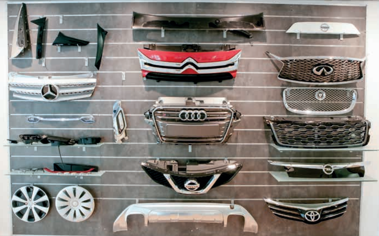
Maierek fabrikatutako automozino piezak.

2016an 300 milioi euroko fakturakzinoa lortu eban eta hazkuntza joera honegaz jarraitzeko asmoa dauka, 2017an 363 milioi euroko salmenta aurreikuspenagaz. Diziplina anitzeko talde espiritua eta osagarria bere sei produkzio plantetan dago, Europa eta Asian zehar. MTCtik garapen eta barrikuntza teknologikoa zabaltzen dabe hauek. MTC Ajangizen kokatutako bere zentro teknologikoa da, planta nagusiaren ondoan.