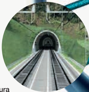
Abiadura Handiko Lineak

ETSk, Eusko Jaurlaritzaren esku dagoen erakunde publikoak, esperientzia luzea du trenbide azpiegituren diseinuan, eraikuntzan eta mantentze lanetan. 250 pertsona baino gehiago eraginkortasunaren, iraunkortasunaren eta bikaintasunaren bila tren kudeaketa. Gure izateko arrazoia da.