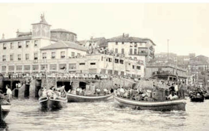
Itsasontziak Bermeora heltzen itsazbidea egin ondoren (1960ko hamarkada).

M undakatik Bermeora bueltan, antxinan "bordeadak" egiten jakezan ontzi ofizialari. Sari bezala, Bermeora heltzean ardu razioak jasotzen ebezan enbarkazioek. Maniobra hauek arriskutsuak ziren, ontziak enbarkazio ofizialaren aurretik gurutzatzen ziren eta honek maniobra hoberena egiten ebana apuntatzen eban ondoren saritzeko. Urteak pasatu ahala eta segurtasun exijentziak direla eta, ohitura hau desagertuz joan da.