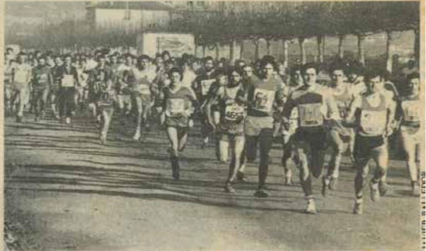
En la mañana del día 31, corredores de todas las edades participaron en el cross de Gernika.