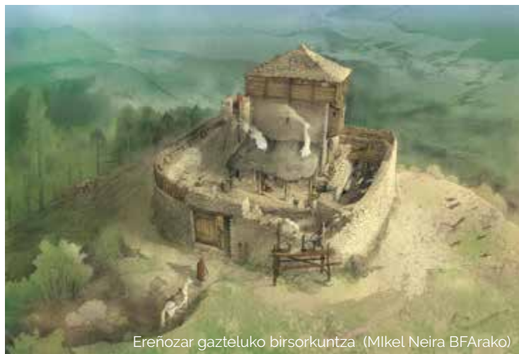
Ereñozar gazteluko birsorkuntza (Mikel Neira BFArako)

Oraindik argitu ez diran arrazoiak direla medio, gaztelua utzi egin ebeen eta, XII. mendetik aurrera parrokia gisa