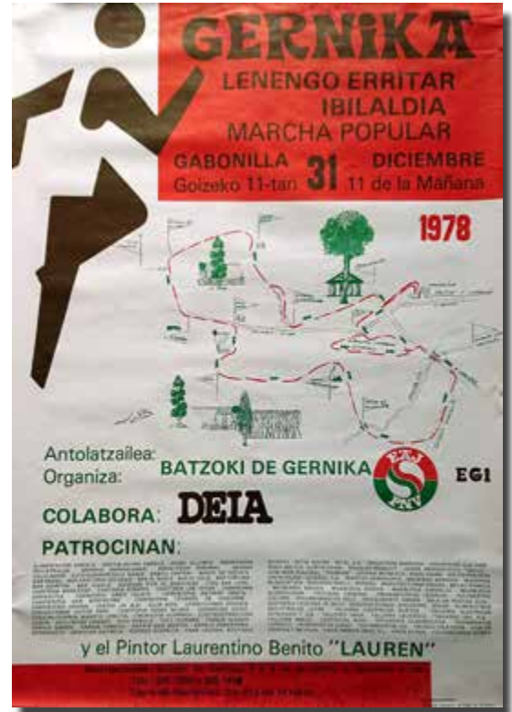
Gernika-Lumoko lehen kros herrikoiaeren kartela, 1978.

Gernika-Lumoko San Silvestre lasterketa arrakasta handia izan arren ez zan jarraitu. Baina korritzeko zaletasuna bizirik dirau urte guztian zehar ospatzen diran lasterketa ezberdinetan. Horren kasu, milla herrikoa edota oraintxu ospatzen dan abenduko Abixadan lasterketa dira. Azken hau, orain 10 urte antolatzen dau Udal Kirol Patronatuak Mendigoizale eta Arin Arin Atletismo taldeen laguntzagaz. "Antxinan ospatzen zan Herri Krosa edota San Silvestrea berreskuratzea izan zan asmoa, baita egiten zan mendi