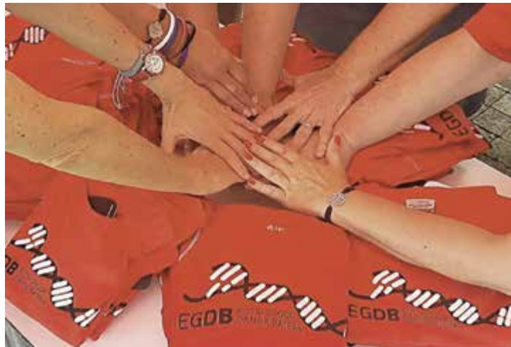
Bermeoko lasterketa solidarioa

Aurton, abenduaren 31ako San Silvestre lasterketa solidarioan lortutako dirua Bermeoko Gela Egonkorrara, patologia ezberdinakotako haurrentzako, eta TEA (Trastorno del espectro autista) delakoaren guraso taldearentzat