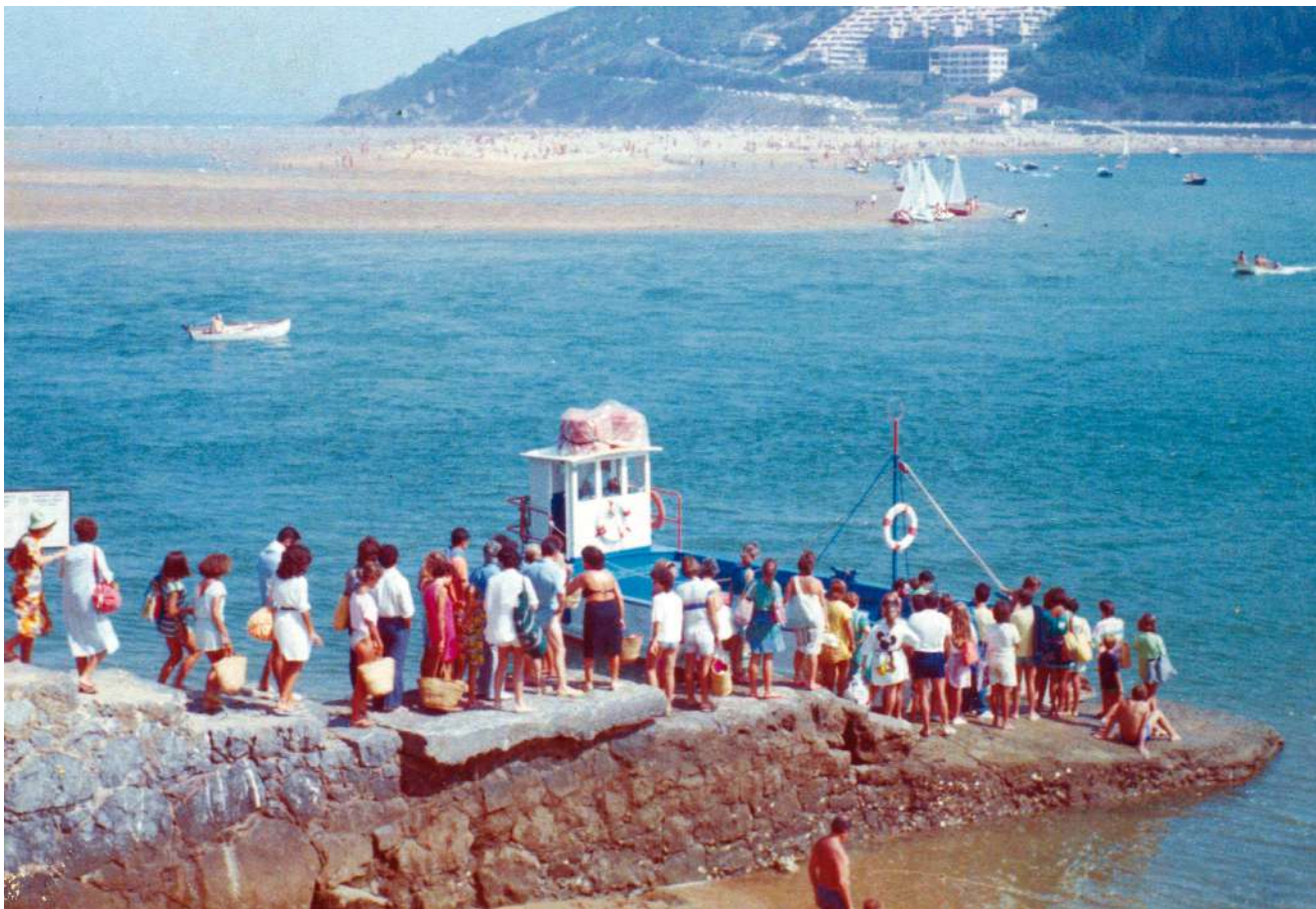
Motrikoren ferryan ontziratzea, Txatxarramendin.