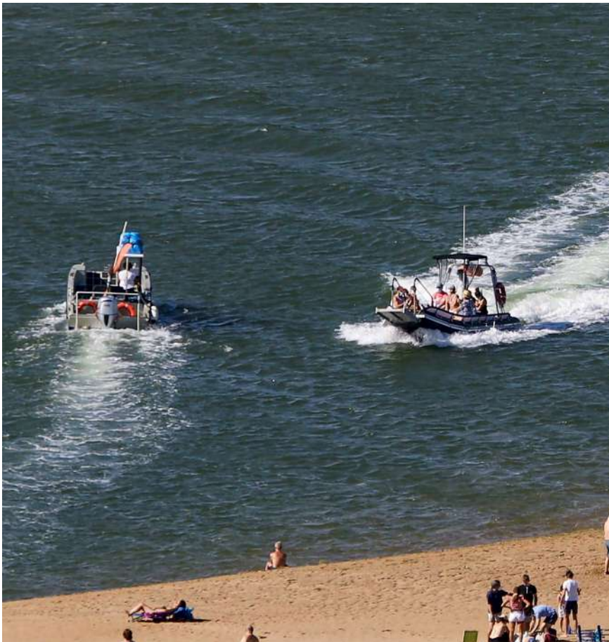
"Izkira Urdaibai" eta "Urdaibai boat", gaur egun zerbitzua eskaintzen daberen enbarkazinoek.