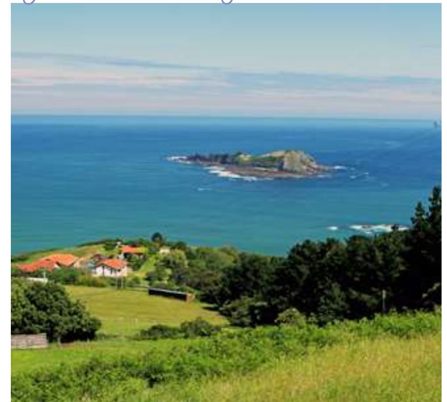
Vistas desde Antzoras, Ibarrangelu. URDAIBAI MAGAZINE 19

Toda esta exquisita riqueza natural, se enmarca además en un personalísimo entorno histórico y social, que hunde sus orígenes en la tradición marinera y baseritarra, que en Ibarrangelu se entrelaza y complementa a lo largo de los siglos en el recuerdo de viejas pero importantes actividades como la construcción naval en los antiguos astilleros de Laida y la dedicación durante siglos, a la marina mercante de buena parte de su población. Como excepcional continente y depositario de los valores esta antigua comunidad, la iglesia de San Andrés de