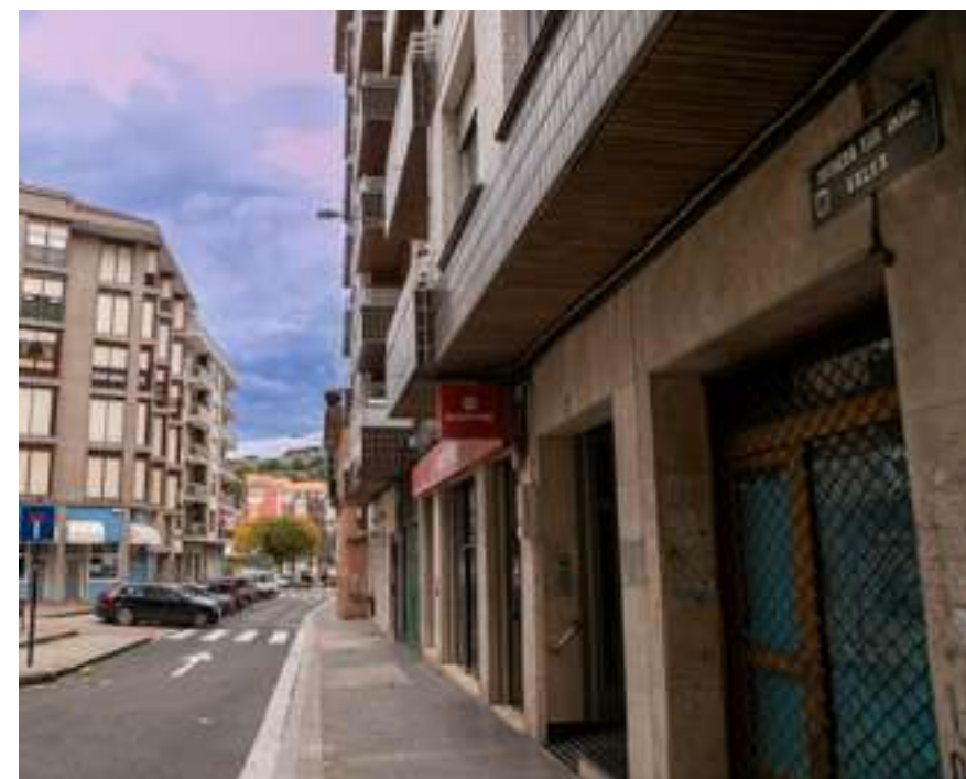
Calle Ñigo de Artieda, Bermeo.

Los Reyes Católicos confiaron en Ñigo de Artieda para crear lo que fue la "Armada de Vizcaya".