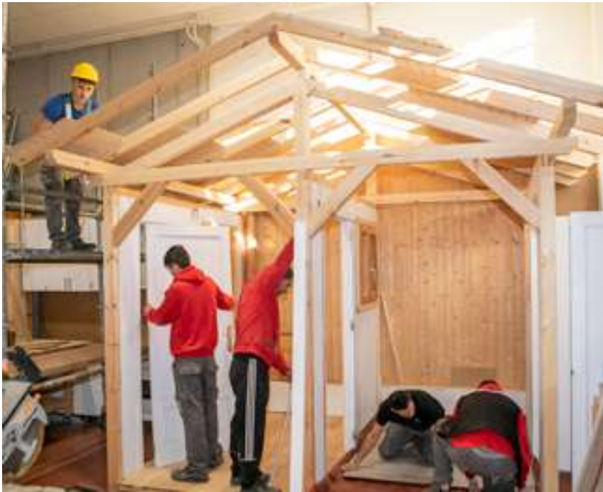
Técnico en instalación y amueblamiento, Barrutialde Institututa (Arratzu).