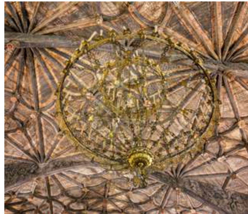
Iglesia de San Andrés, Ibarrangelu

Laga, la playa de cara al mar, ofrece una experiencia más "salvaje", con un fondo de dunas que encara al mar abierto, uno de los escasísimos arenales que conservan su perfil natural inalterado. Entre las dos grandes playas, la recoleta cala de