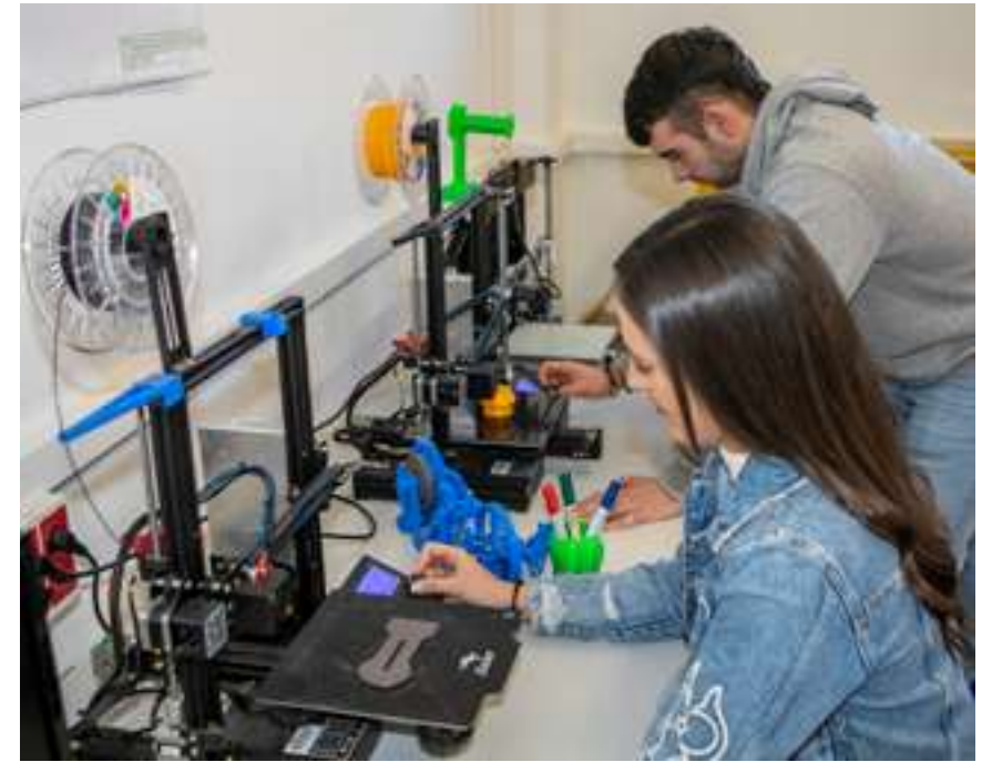
Técnico superior en diseño en fabricación mecánica, Barrutialde Institututa (Arratzu).

La formación es vital para la búsqueda de empleo, una formación que debe estar adaptada a las necesidades del mercado. Y no solo para las personas desempleadas, también para las personas trabajadoras. En ambos centros Behargintza ofrecen formación de distinta índole: adaptada a las necesidades de las personas emprendedoras, para que adquieran conocimientos transversales en gestión empresarial; ayudas al pequeño comercio y la hostelería, para mejorar su competitividad, "por ejemplo con formación de TicketBai, que en el 2024 será obligatorio en Bizkaia"; añaden desde Behargintza Bermeo. Un área en el que también trabaja Lanbide Ekimenak- Behargintza Gernikaldea. "Esta formación está enfocada a autónomos o microempresas, para poder mejorar su gestión y competitividad empresarial. Se han ofrecido cursos o talleres con diferentes temáticas, como Ticketbai, ciberseguridad, gestión digital, redes sociales, presencia web, entre otras. No hay