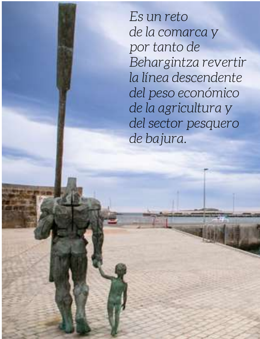
Puerto de Bermeo

Es un reto de la comarca y por tanto de Behargintza revertir la línea descendente del peso económico de la agricultura y del sector pesquero de bajura.