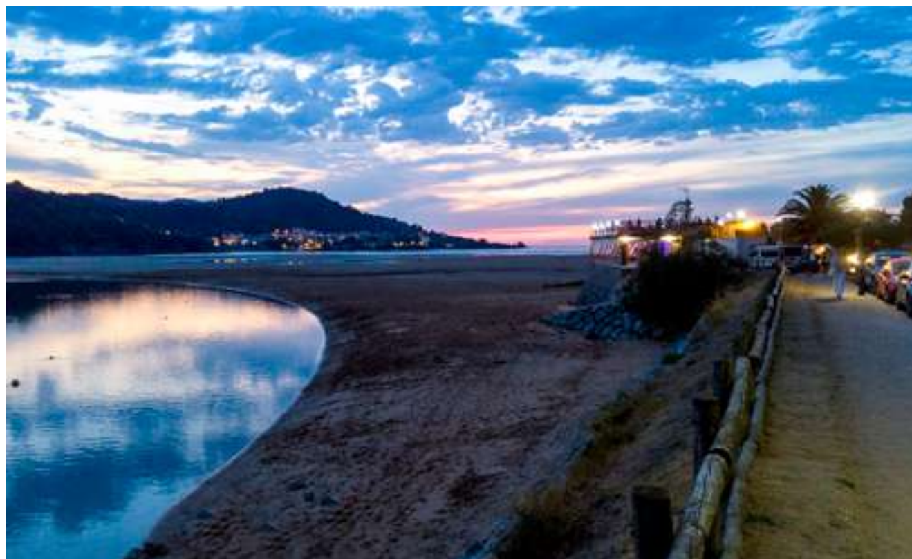
Playa de Laida, Ibarrangelu

carabineros, en Antzoras, un pequeño paraíso dominado por el sonido y los olores del mar.