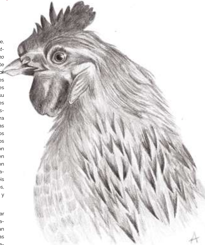
Ilustración: Amelia Urien

En nuestros caseríos la tradición de criar y comer capón por Navidad está íntimamente ligada al pago anual que debían hacer los inquilinos por trabajar las tierras y vivir en el caserío. Al aproximarse la Navidad el pago a los arrendadores con los capones cebados más que tradición era