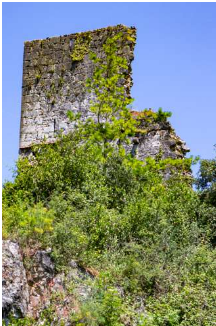
Casa Torre de Urdaibai, hoy día.

A pesar de su estado ruinoso es fácil imaginar que un día tuvo una esbelta figura. El edificio, de piedra caliza de gran calidad, no tiene cimientos y está levantado sobre la propia roca. Sus muros poseían un grosor aproximado de un metro y la torre se calcula que podría alcanzar los 12-13 metros de altura. Existen diferentes versiones sobre el origen de la Casa Torre Urdaibai. Según el investigador Juan Ramón de Iturriza (1741-1812), la Casa Torre la fundó Lope Ansote de Ajangiz en el año 844, y en el siglo XI reaparece en la documentación de uno de los edificios donados al monasterio de San Millán de la Cogolla por Don Iñigo López. Otra versión de su origen sitúa la primitiva torre a finales del siglo XV, cuando la construyó un descendiente de Hurtado García de Avendaño, familia originaria de la llanada alavesa que, a partir