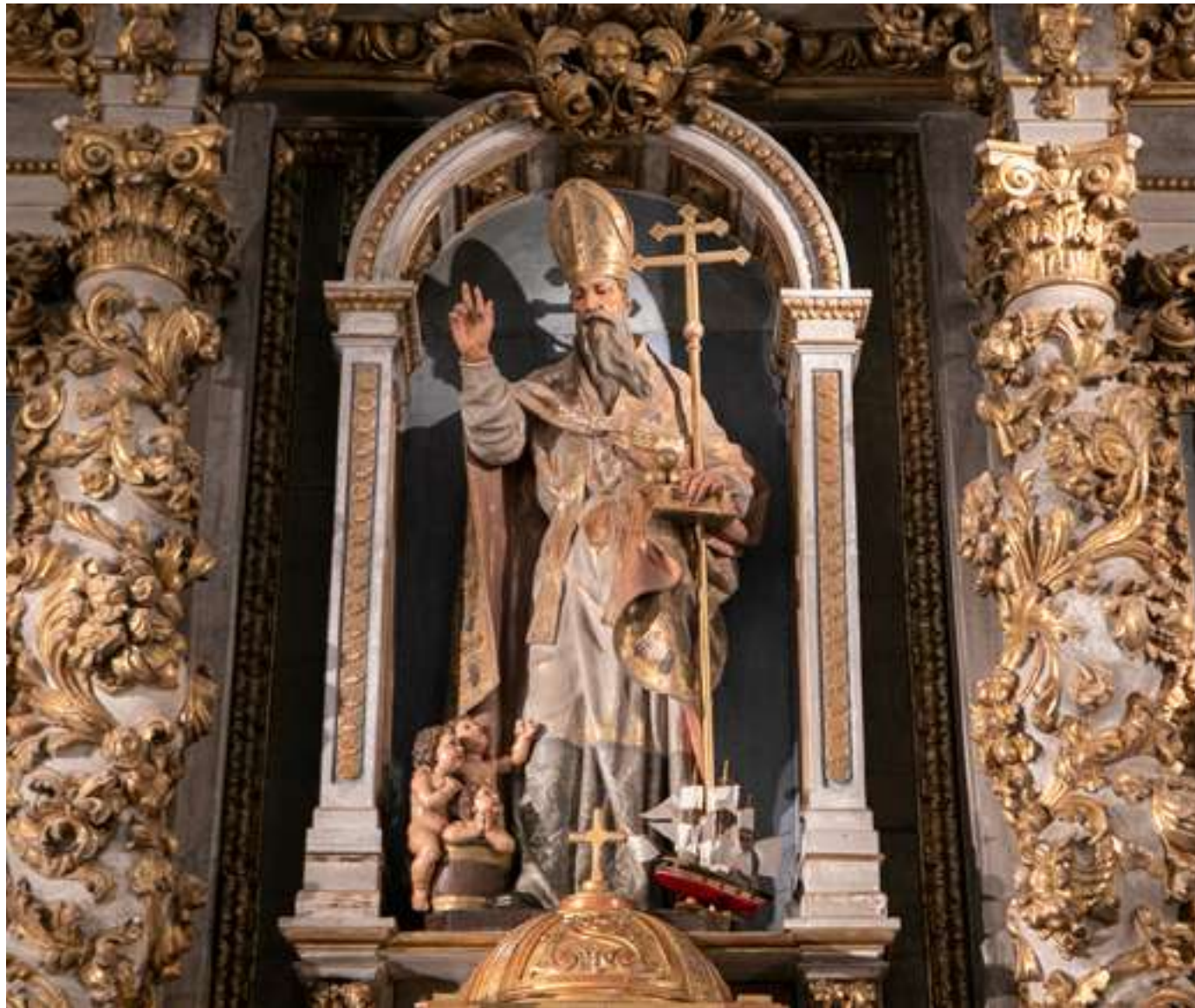
Iglesia San Nicolas de Bari, Elantxobe