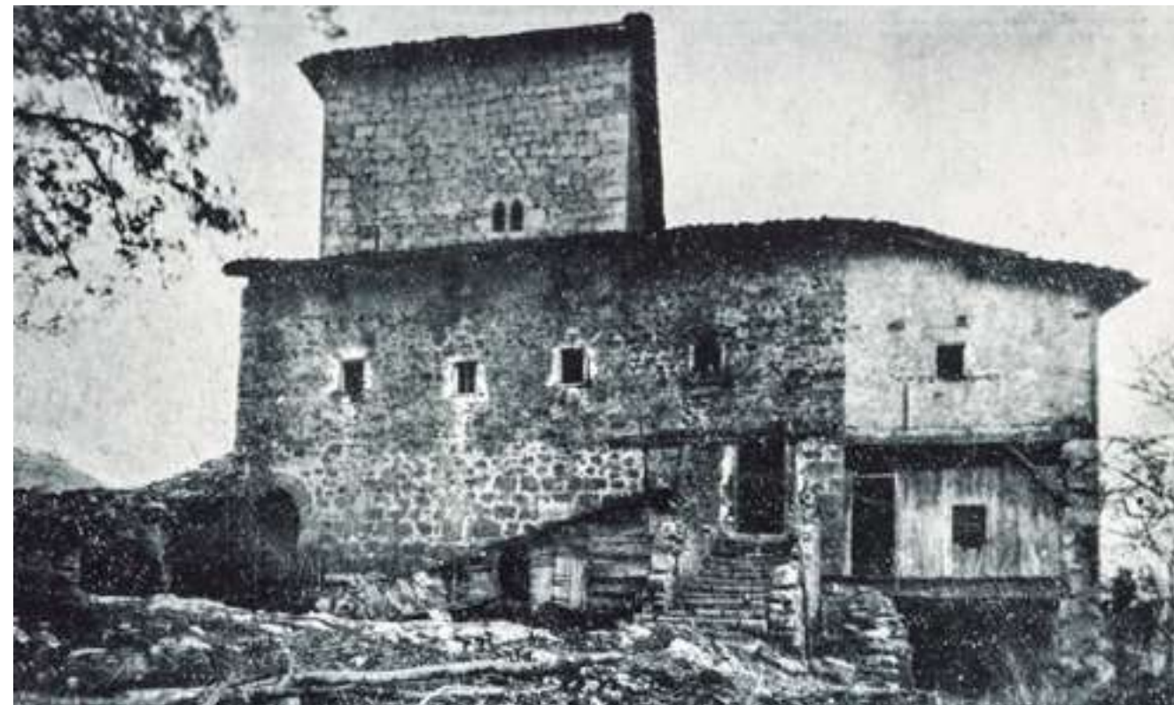
Casa Torre de Urdaibai.

del siglo XIII, inicia un proceso de asentamiento en Bizkaia. La casa Torre aparece mencionada en distintos contratos de arrendamiento en el S.XVII, y también está documentada en la Fogueración de 1641 (enumeración de fogueras, recuentos, registros o censos de los «fuegos» o casas solariegas), donde encabeza el listado de fogueras de Forua.