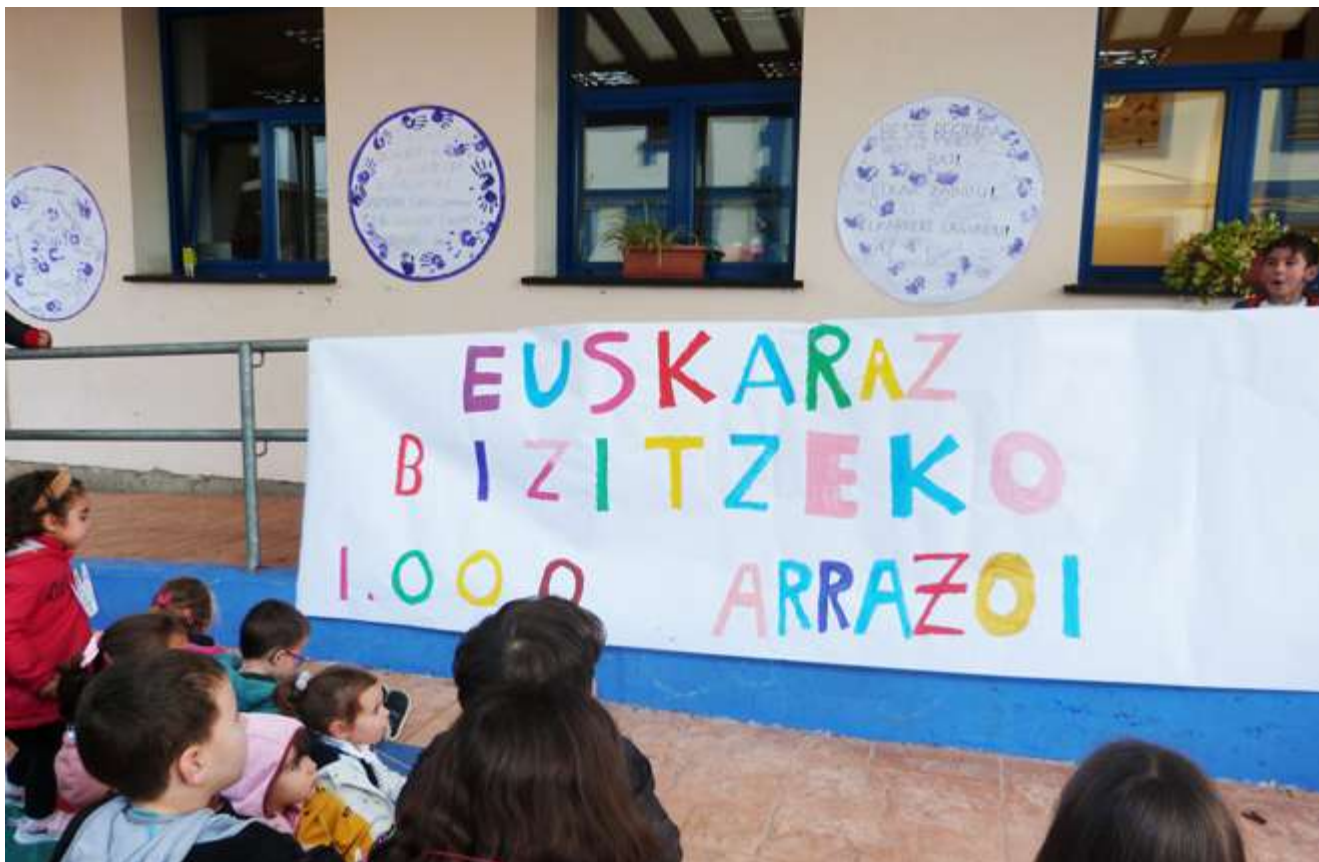
Montorre Eskola (Gautegiz Arteaga)

Gure seme-alaben eskolatzeari buruz berba egiten dogunean, prestakuntzarik onena bilatzen dogu, ikastetxe handietan pentsatzeko joera daukogu. Halanda be, frogatuta dago eskola txikietan oinarri sendoak sortzen dirala letra larriz hezteko. Busturialdeko eskola txikiak bizirik diraute, gure herrietako bizitzarako ezinbesteko oinarri izanez.