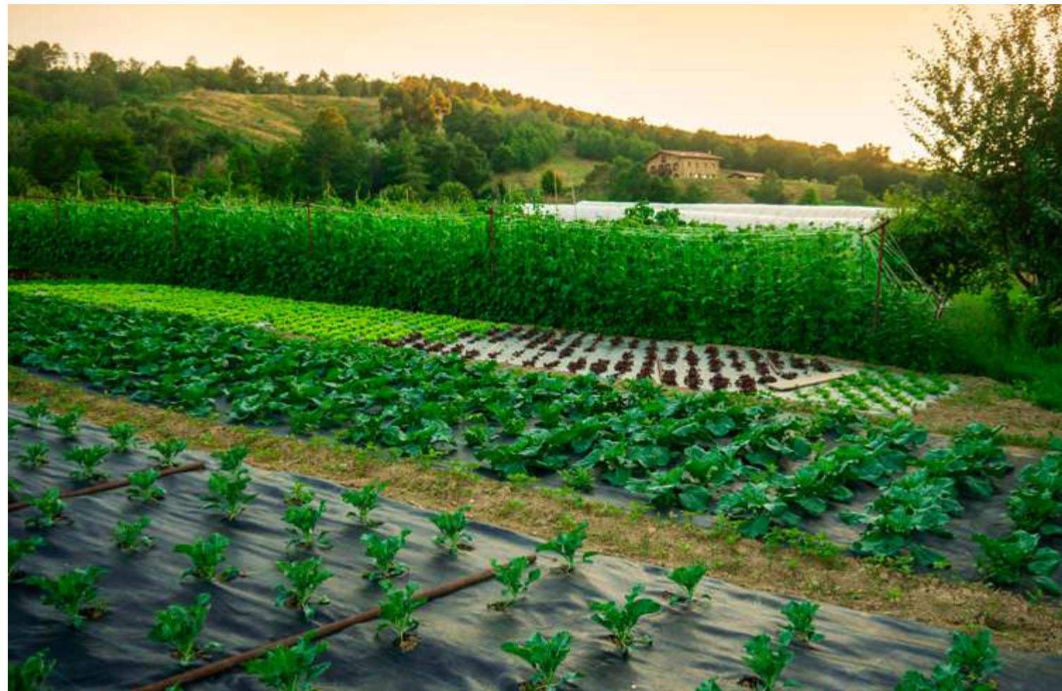
Lurkoi Baserriko ortuak

Laster hasiko dira espezie autoktonoak basobarritzeko eta laborantzarako lurrak handitzeko proiektua