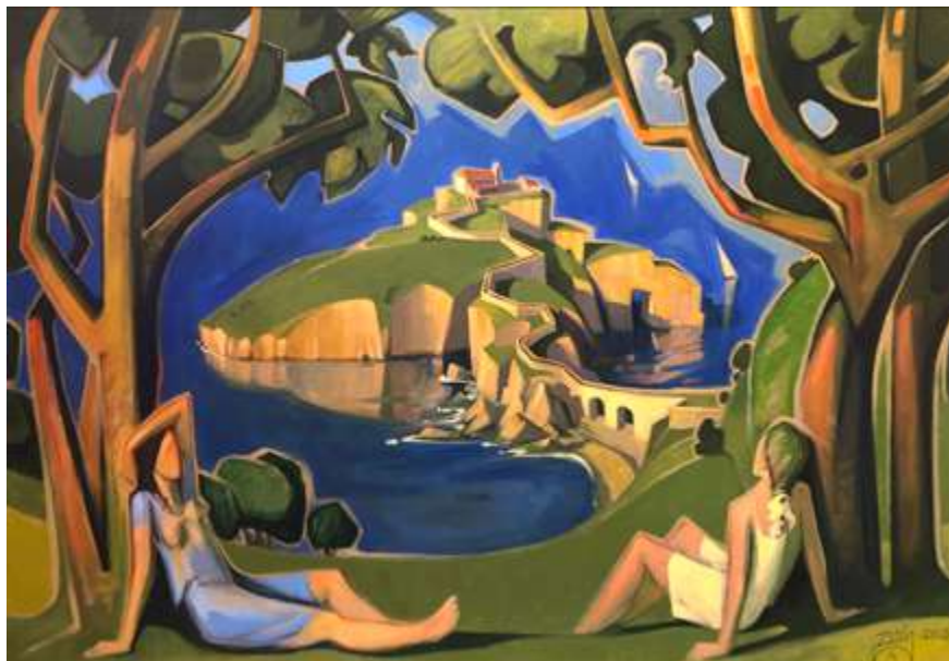
Enrike Zubiaren lana.

Arteak gizartearen sustaritututa egon behar dau. Arteak gizartearen babesa izan daian, gizartearekiko kezka izan behar dau. Ez daiala pentsa artea artisten kontua danik.