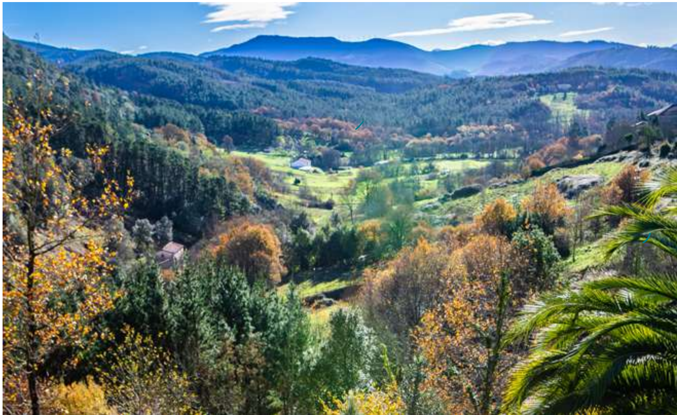
Gautegiz Arteagako ikuspegia Muruetaganerako errepidetik