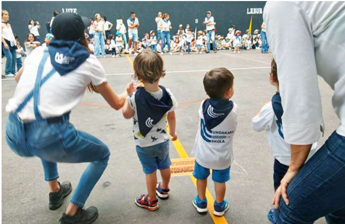
Busturialdeko Eskola Txikien jaia