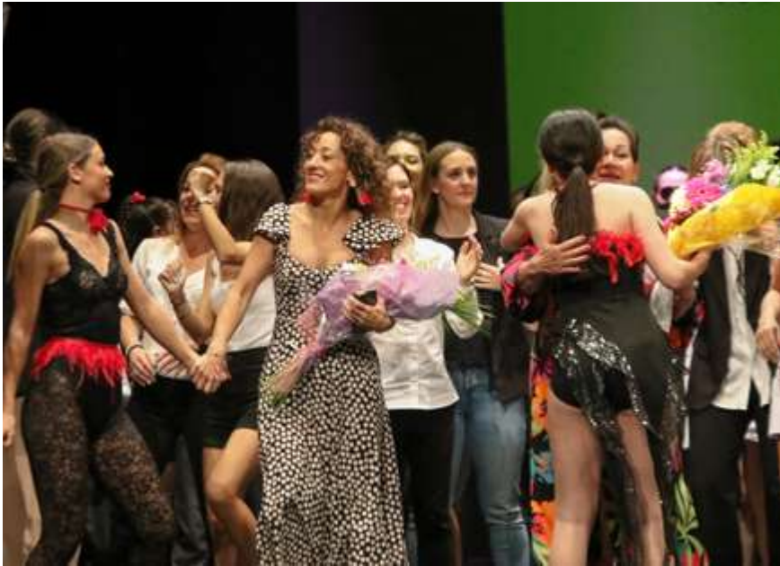
Ross bere dantza eskolako ekitaldi baten amaieran.