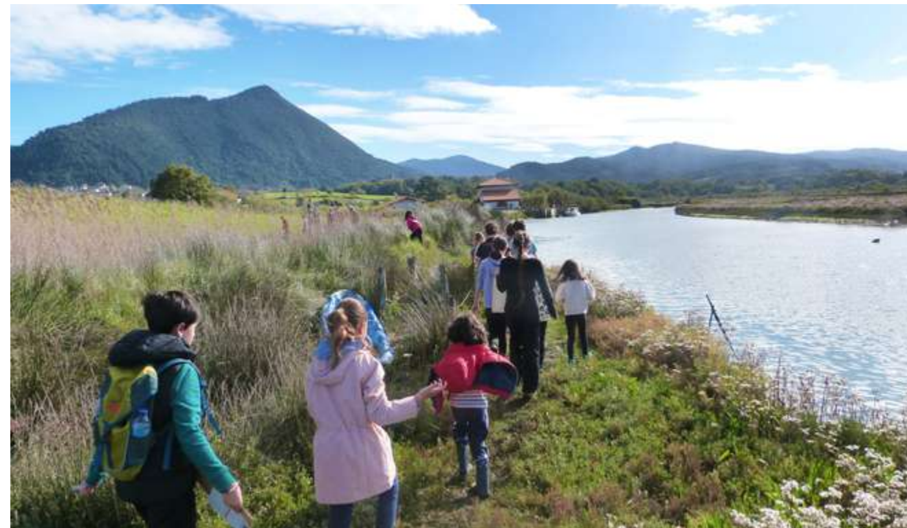
Montorre Eskolako ikasleak Gauegiz Arteagako paduran

Busturiako J.M. Uzelai eskolan gauza bera gertatzen da, Murueta 2 kilometro eskasera dagoela. "Murueta 2 umeak doaz Gerrika-Lumoko Allendera. Muruetatik geure eskolara datozen umeek ez dauke ez autobus zerbitzurik ez laguntzarik, geure zonifikaziotik kanpo dagoelako. Eskatu dogu askotan aldatzeko baina administratibotik ezetza daukagu", aipatzen dabe Busturiako J.M. Uzelaitik.