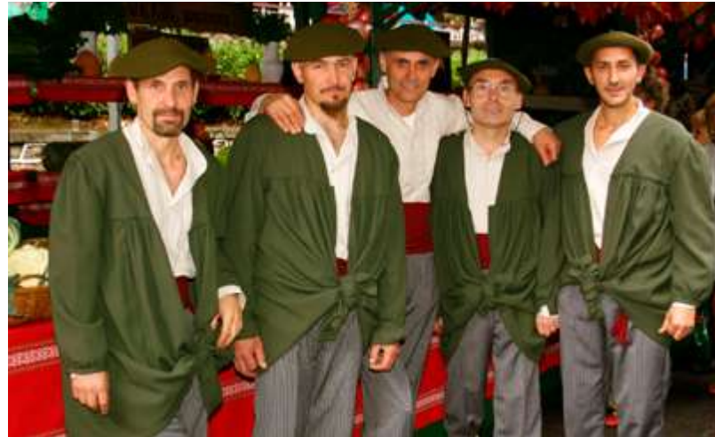
Lurkoi Baserriko kideak.

Euren bizi-filosofia zabaltzeak Lurdeia Baserria sortzera eramán eutsoen, orain dala ia 18 urte. Hotel honek sari garrantzi-