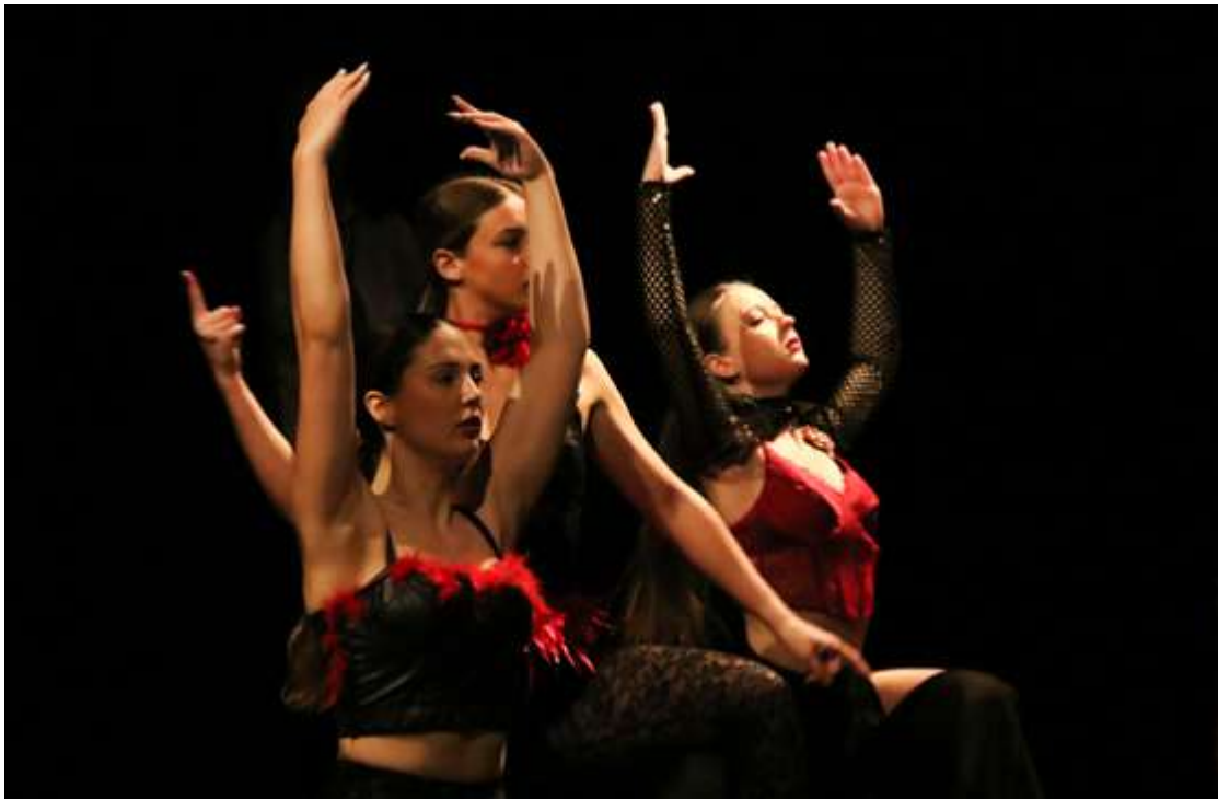
Ross Dantza Eskolako ikuskizuna.

baloratzen dabe, ondo egiten badabe, baina bakarrik egin behar dabe. Gure ikasleek daukeen adorea gure harridura geratzen naz, epai-mahai baten aurrean dagozelako, pianista batez eta Espainia osoko jendeagaz. Euskal Herritik ACADE-gaz hastean aitzindaria izan naz.