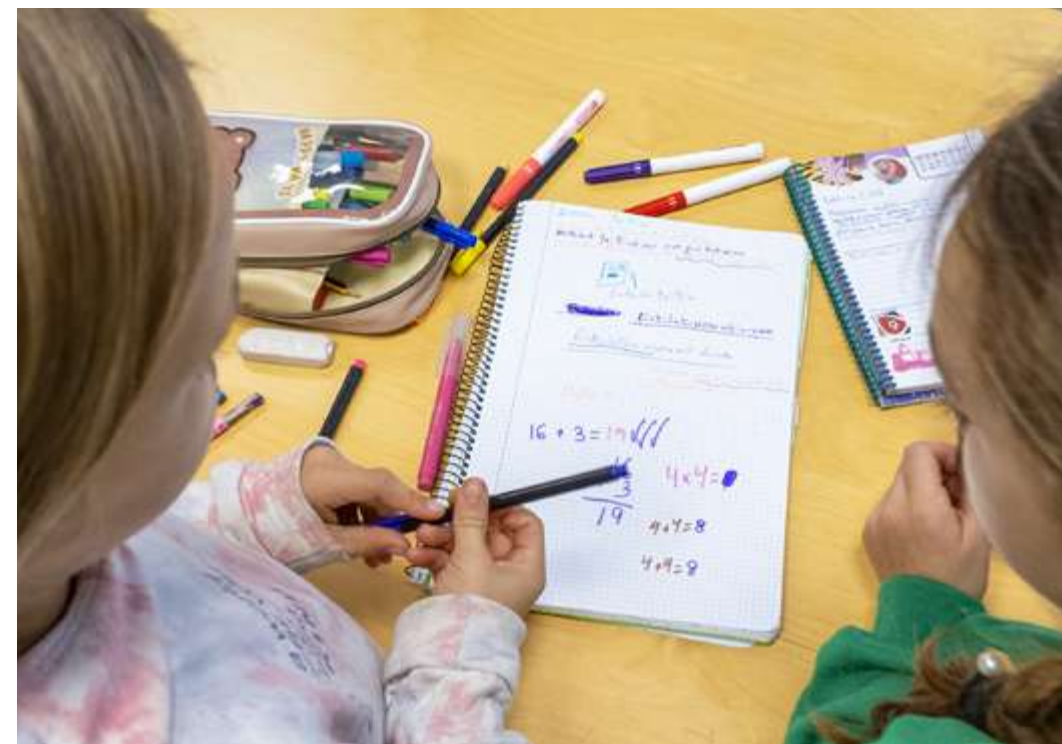
Adin desbardinetakoa ikasleak batera ikasten

1 "Amara Berri": Euskadiko ikastetxeetan hedatutako ikaskuntza-sistema, proiektuaren erdian haurra dagoela, bere garapen globala eta harmonikoa. Bere nortasunaren edo harreman sozialen garapena kontuan hartzen dau, haur hezkuntzatik lehen hezkuntzaren amaierara arte. Jolasaren eta imitazioaren bidez hazten laguntzen saiatzen da. Beste metodologia batzuen artean, adin nahasketako ziklo programekaz lan egiten da. Bizkaian Allende Salazar Ikastetxeak (Gernika-Lumo), Etorkezuna Ikastolak (Abanto-Zierbana), Landako Eskolak (Durango), Larrea Eskolak (Amorebieta-Etxano), Mundaka Eskolak, San Frantzisko Herri Ikastetxeak (Bermeo) eta Zelaieta Herri Eskolak (Abadiño) aplikatzen dabe sistema hau.