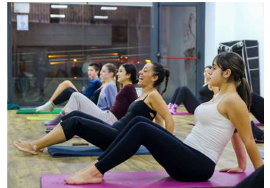
Ross bere klase batean.