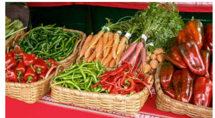
Lurkoi Baserriko produktuak Gernika-Lumoko Urriko Azken Asteleheneko azokan