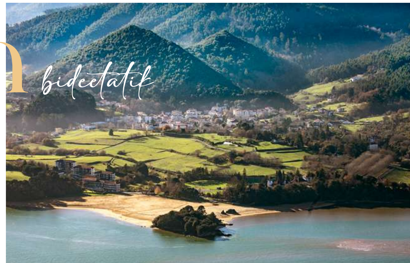
Artadi kantauriarraren ikuspegi orokorra Busturian