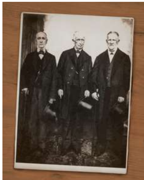
Gaspar de Bulucua erdian

Gaixotasun sendagarrietan purgau, errepikapen eta maiztasun desbardinakaz, gaixoa sendatu arte. Laburbilduz, Le Roy jaunak gaixotasun guztiak bakar batera murrizten dauz, hau da, osasunaren kontrakora, eta sendatzeko metodo guztiak erradikal bakar batera, purgea emon.