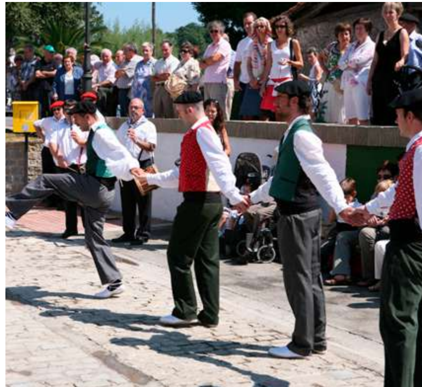
Foruko Urdaibai Dantza Taldea

MaB programa ekosistema guztiak eta giza jarduerak haiengan daukozen ondorioak hobeto ezagutzea beharrezkoa zalakoan uste osoa jarrita sortu zan, "gehiago ulertzeko hobeto jarduteko asmoagaz". Natura-baliabideak erabiltzeko jarduera komunak hobetzea proposatzen eban programa zientifiko lez sortu zan, ez