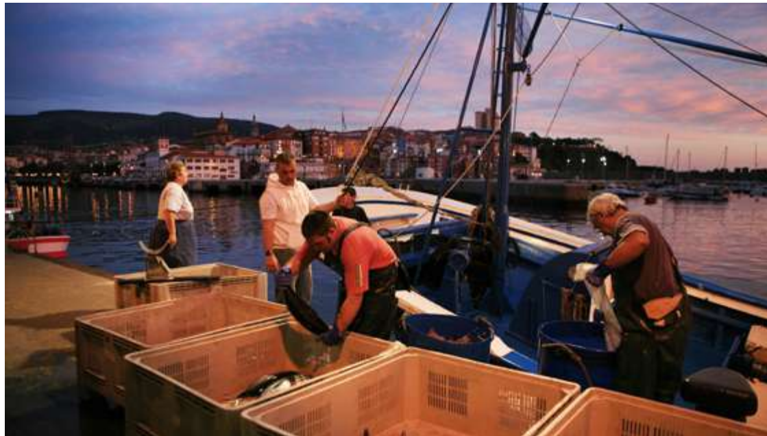
Arrantzaleak Bermeoko portuan

Bizi-ereduen eta naturaren babesle izan zan korse bera, neurri batean, kaiola trinkoa izan da, gizarte- eta natura-fluxuetara egokitzeke legeen geldotasuna dala eta. Gainera, zurruntasun horrek ez dau eragozten indar harrapariek, beren adierazpen askoetan, harrapatzeke errazak diran alderdiak aurkitzea, arretaz az-