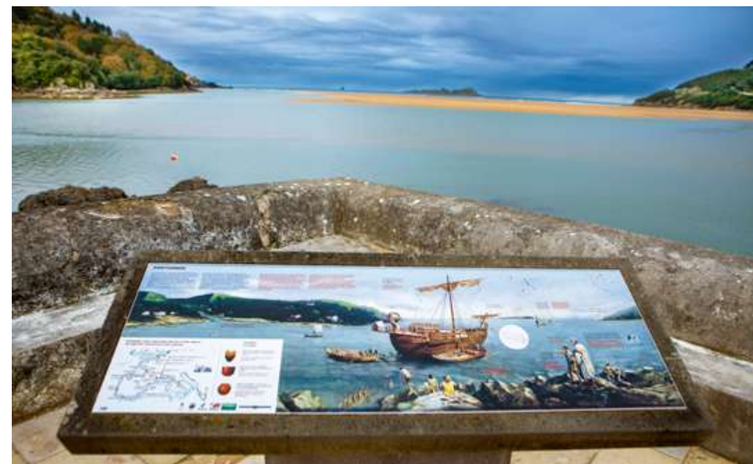
Portuondoko ainguralekuko jardueraren gaineko interpretazio panela. Txatxarramendi irlako ontziralekua