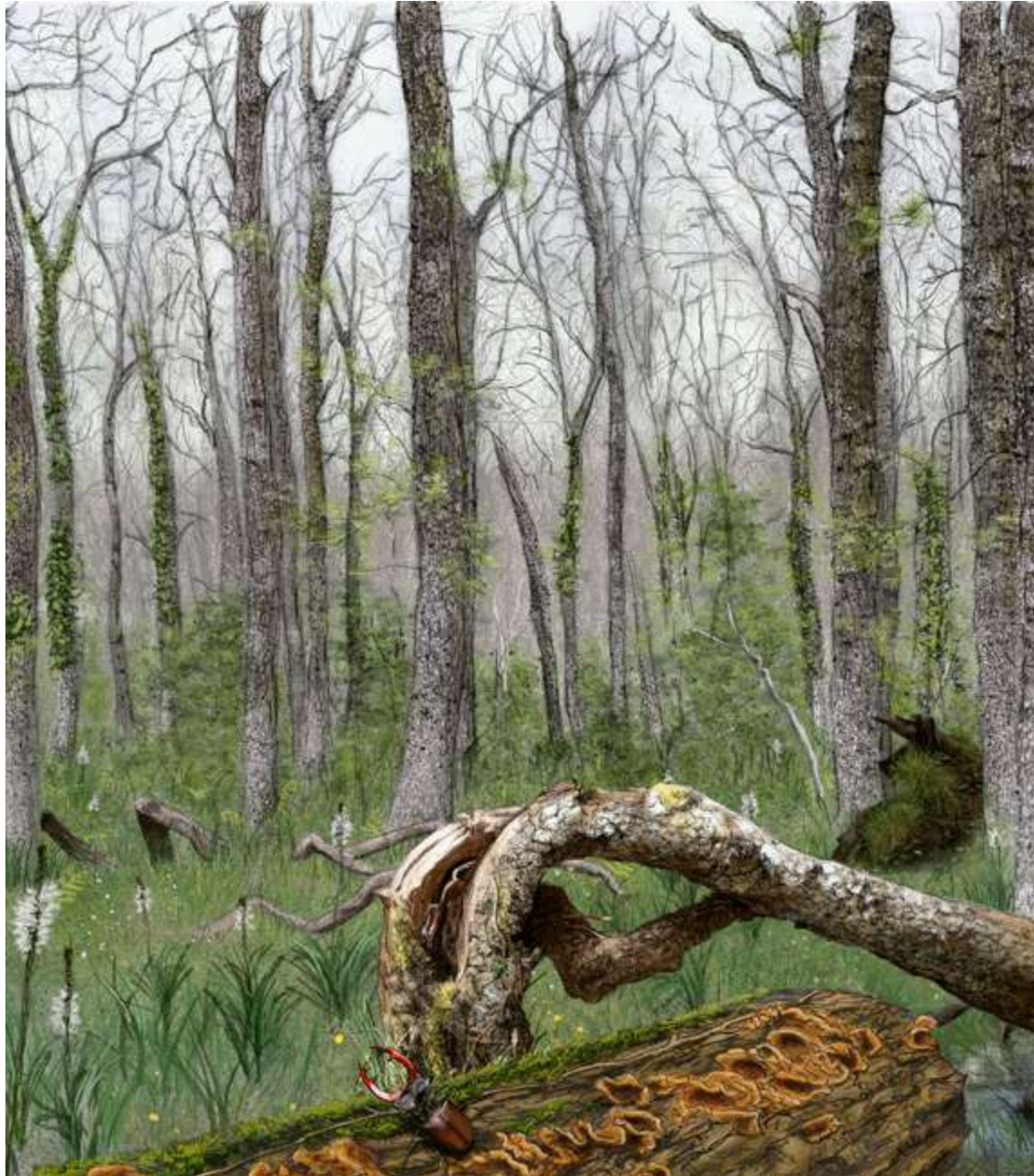
Egur hil askoko baso heldua, kakalardo adardunaren babeslekua eta janaria. Ilustrazioa: Nuria González

Kakalardo adarduna, ikustea gero eta gaxagoa bada be, ohiko espeziea da geure inguruan. Koleopteroen ordenakoa eta lukanidoen familiakoa da ( Lucanus cervus ). Europako kakalardo handiena da, eta 9 cm inguru neur daike.