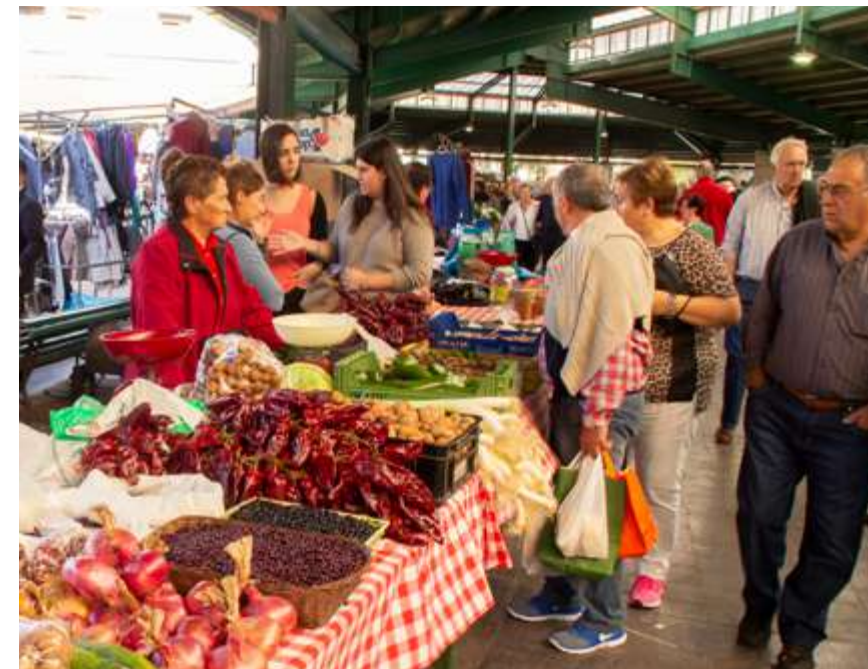
Gernika-Lumoko merkatu plaza

Komunidade zientifikoak, gizarte kontsumista suntsitzailerean aurrean, ohiturak aldatzeko beharra ikusi eban. Horrela, 70eko hamarkadan, UNESCOk Gizakia eta Biosferari buruzko Programa (MaB, ingelesezko siglak) jarri eban martxan. Perso-