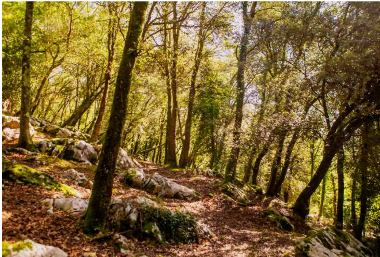
Arteen arteko bidexka, Santimamiñerako bidean Gauegiz Arteagatik