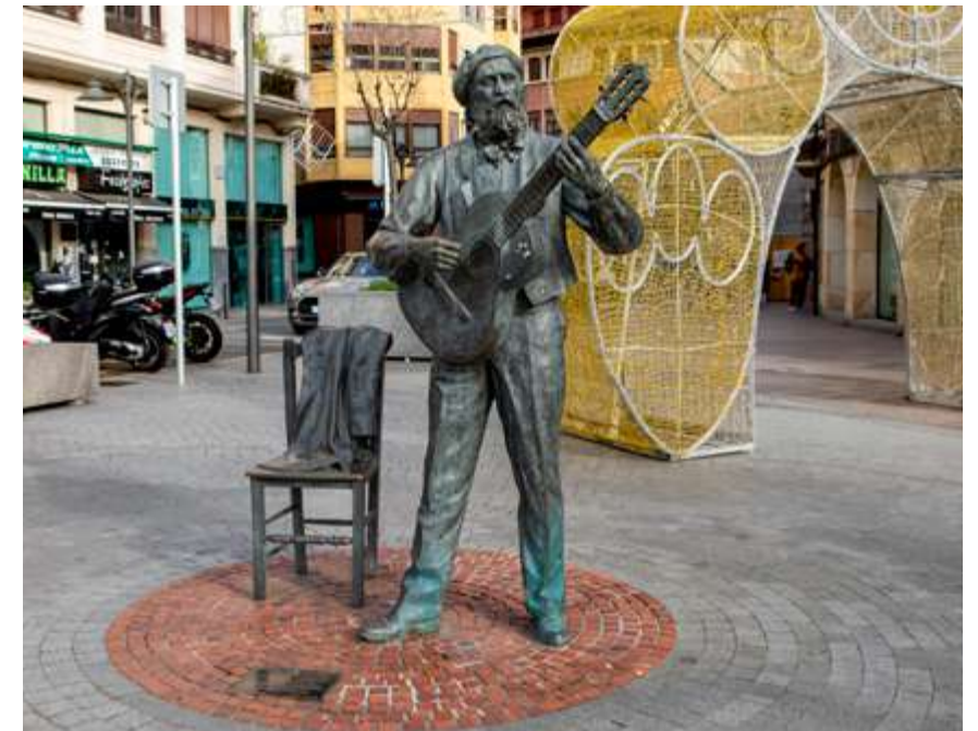
Gernika-Lumoko erdigunean dagoen Iparragirreren estatua