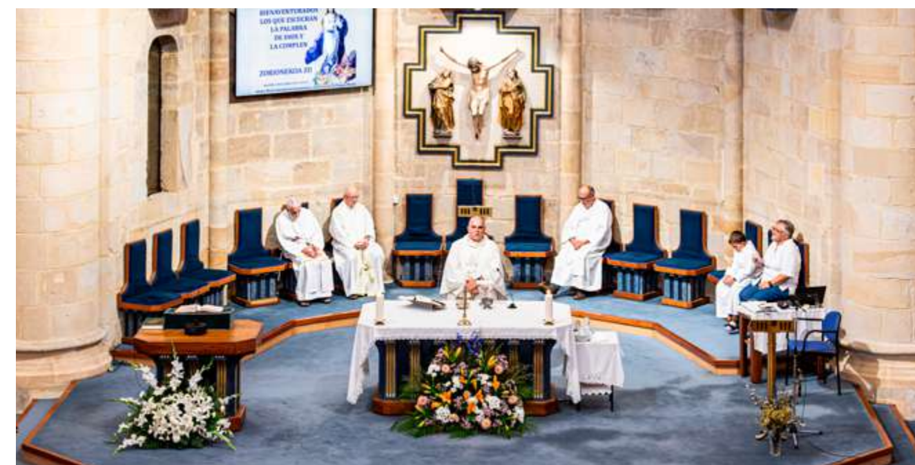
Gernika-Lumoko Andra Mari Eleizan meza ospakizuna.