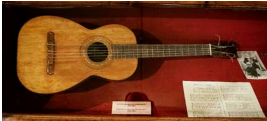
Jose Maria Iparragirreraren gitarra Gernikako Batzar Etxean

eben, gero Euskadira etorteko. Bere nor-tasun ibiltariaren erakusgarri da enbata gogor batean itota hil ziran Gipuzkoa eta Bizkaiko hirurehun arrantzaile baino gehiagoren familien alde Madrilan egindako esku-hartzea (1878).