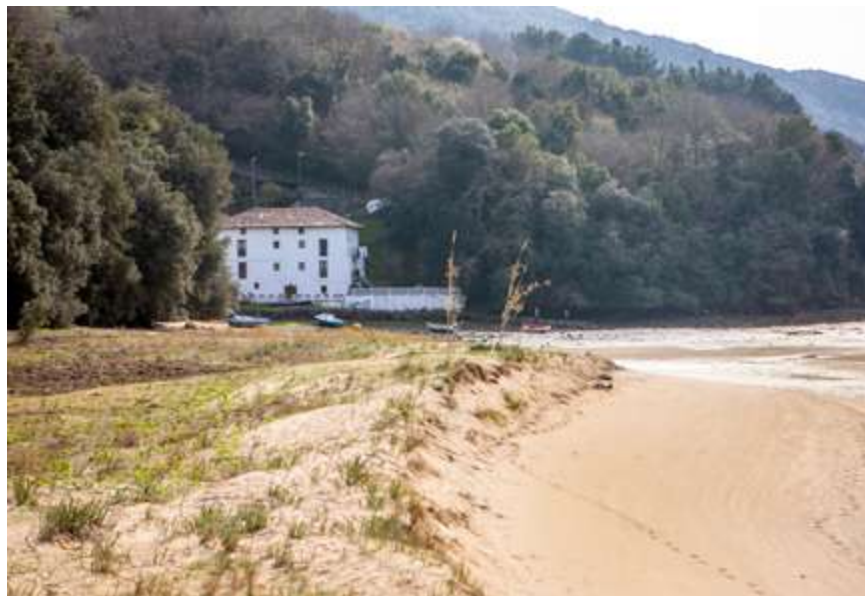
Solabe hondartza eta Kanalako antzinako ontziola

Trebetasun horreek ez dira inongo unibersidadetan ikasten, eta lurraldearen iraunkortasun handiagoko ibilbiderantz eboluzionatzeko beharrezko tresnak dira. Biosfera-erreserba eta honen sare bakoitzak, erreserben sustatzaileek euren lanbidea ikasteko eskola iraunkorak dira. Ibilbide horretan, kudeatzaileen funtzioak >>>