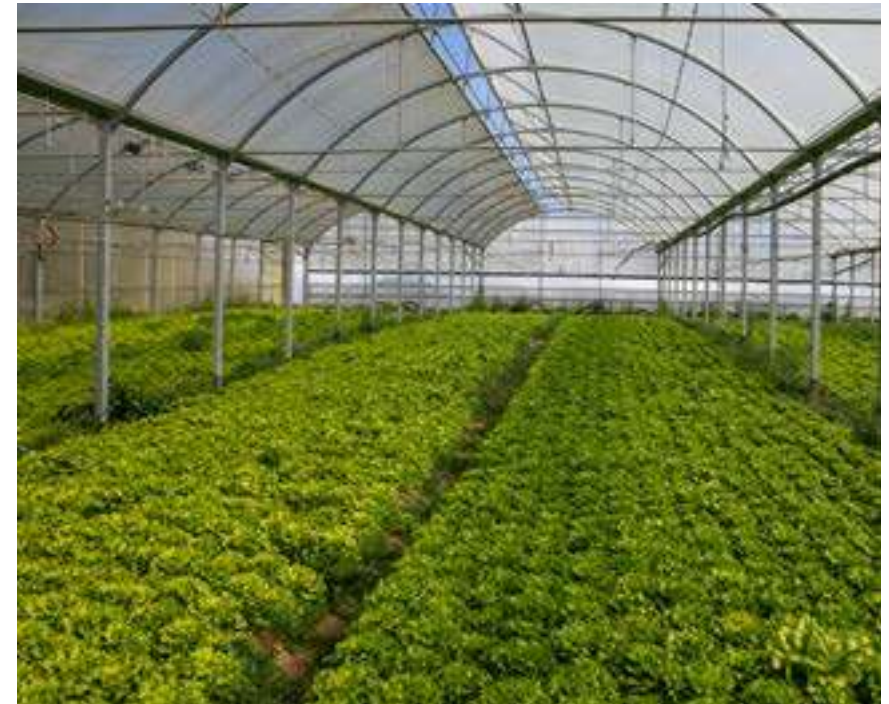
Plantación de lechugas en el invernadero de Lapikote Baserria.

Lo veo mal. Yo seguiré, pero aquí no habrá relevo. Todos piensan como yo. Si no cambia nada, y no creo que cambie, en unos años aquí nadie va a plantar nada. Todo se va a traer de fuera, empezarán a traer de España, luego de Marruecos... Yo aguantaré hasta que me jubile. Los baserritarras con hijos adolescentes, no creo que quieran que sus hijos sigan con la tradición del caserío, preferirán que trabajen en otra cosa. Conozco a mucha gente de aquí que se ha dedicado toda la vida a esto y al jubilarse el padre no han segui-