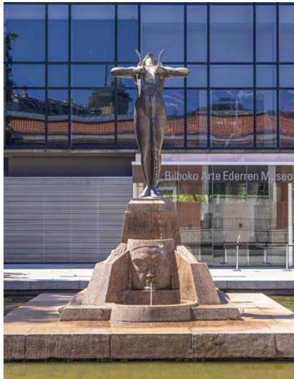
Escultura en homenaje a Juann Crisóstomo de Arriaga, en Bellas Artes, Bilbao

Destacó desde muy niño por sus grandes capacidades musicales, un talento al que hay que sumar el apoyo familiar. La familia paterna de Juan Crisóstomo de Arriaga pertenecía a la clase alta, en su origen hay señores o "jauntxos" de Errigoiti con participación en las Juntas Generales, alcaldes... así consta en la documentación recogida en la Sala Etnográfica de Errigoitia, que recopila la información histórica del pueblo y donde no puede faltar la figura de Juan Crisóstomo de Arriaga.