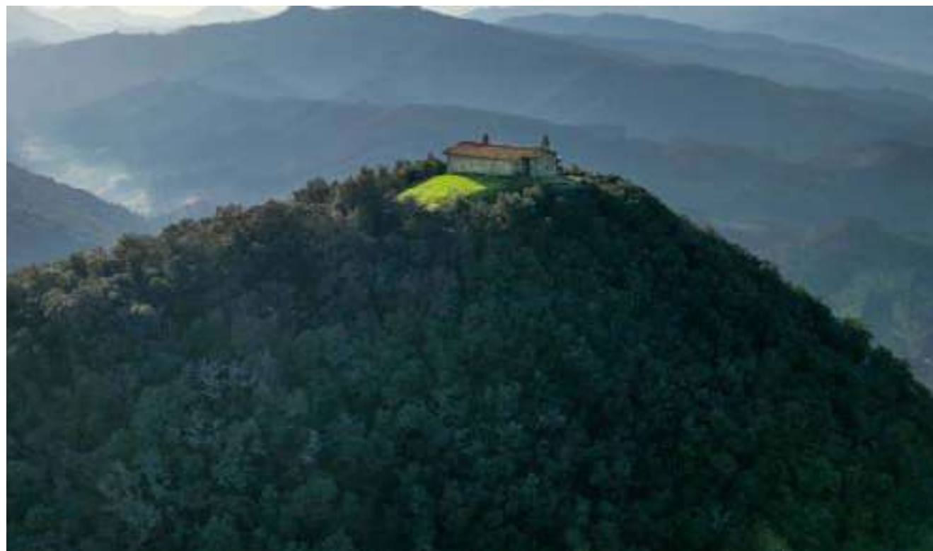
Ereñozar, a vista de dron.

Esta panorámica es un lujo añadido a los variados y soberbios paisajes por los que se deslizan los caminos forestales de las rutas que desde Elexalde, Atxoste y Bollar, pasan junto a Itxurintxaurreta, Busturrian o Kabelinatxa y se dirigen hacia el vecino municipio de Nabarniz.