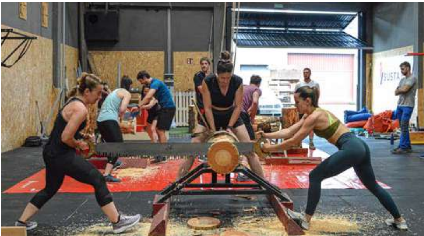
Trontza en el Centro de Herri Kirolak Sustabiz, Box Crossfit Gernika.

Gure Kirolak Sustatzen Jardunaldi Partehartzaileak 2024 se centra en organizar en los 20 municipios de Busturialdea-Urdaibai encuentros participativos para niños y niñas en edad escolar (entre 6 y 14 años), para crear afición y fomentar, desde edades tempranas, la cultura y la práctica de nuestros deportes vascos, deporte rural,