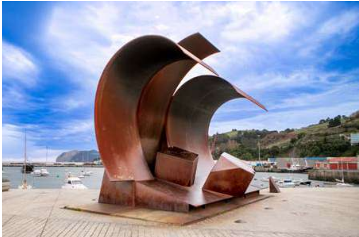
Escultura Olatua , en el puerto de Bermeo.

toriales, entre otras. El programa del Centenario de Basterretxea cuenta, además, con una página web ( https://nestorbasterretxea100.artium.eus ) que recoge información y recursos sobre su vida y su obra, desde la que se puede acceder al valioso archivo donado por su familia al Museo de arte Contemporáneo del País Vasco, Artium Museoa.