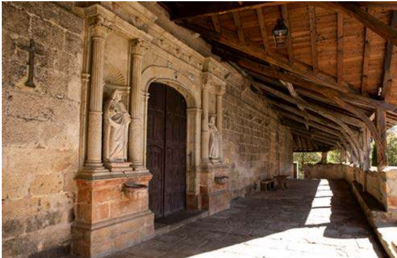
Pórtico de la Iglesia de Meakaur, Morgia