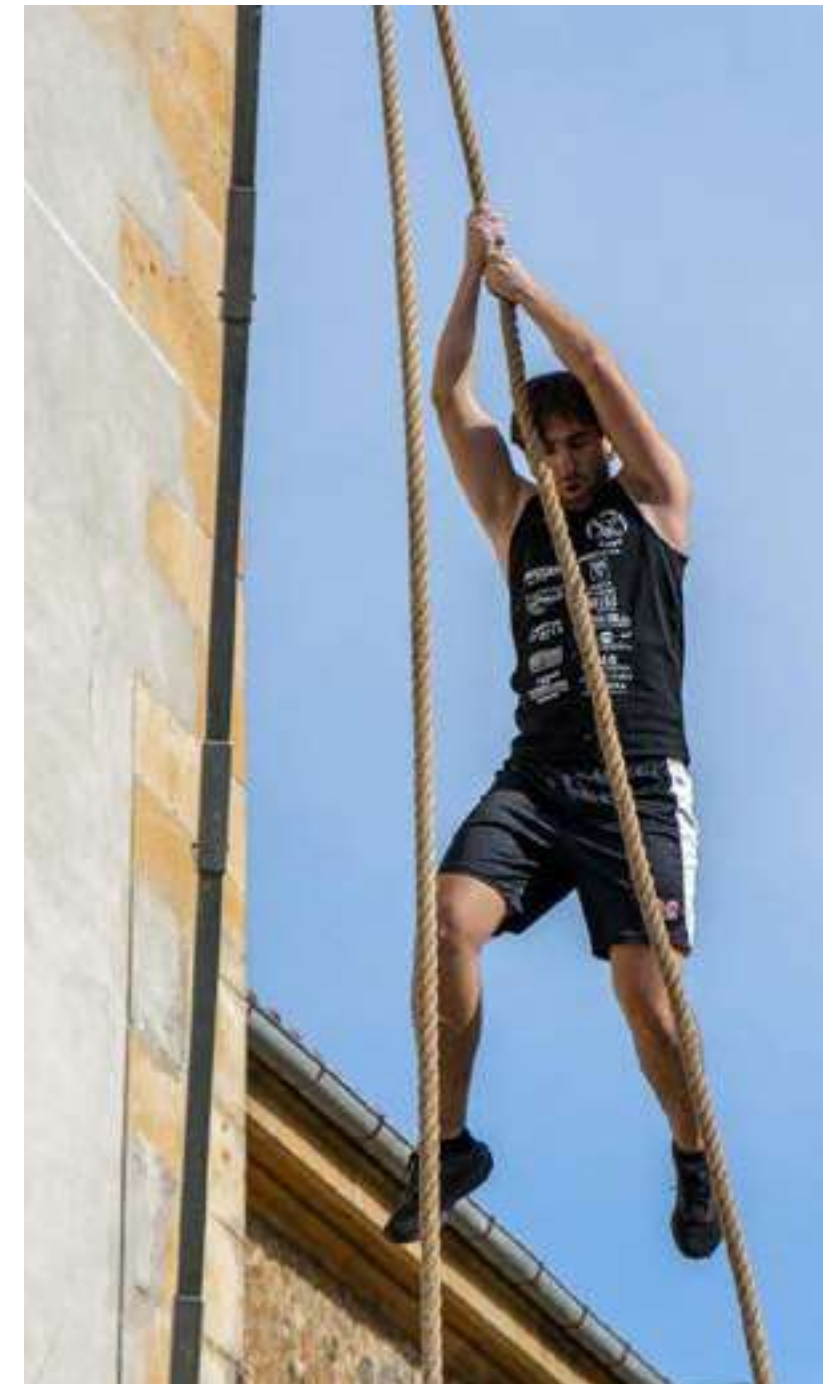
Exhibición de Lasto jasotze.