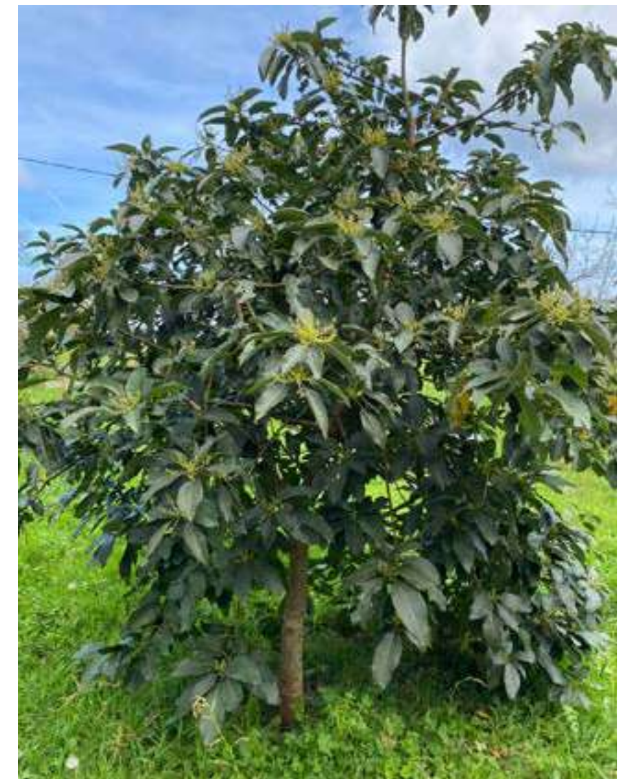
Árbol de aguacate, Forua.

Quien esté pensando en plantar aguacate, debe saber que la primavera es un buen momento para su plantación y para >>>