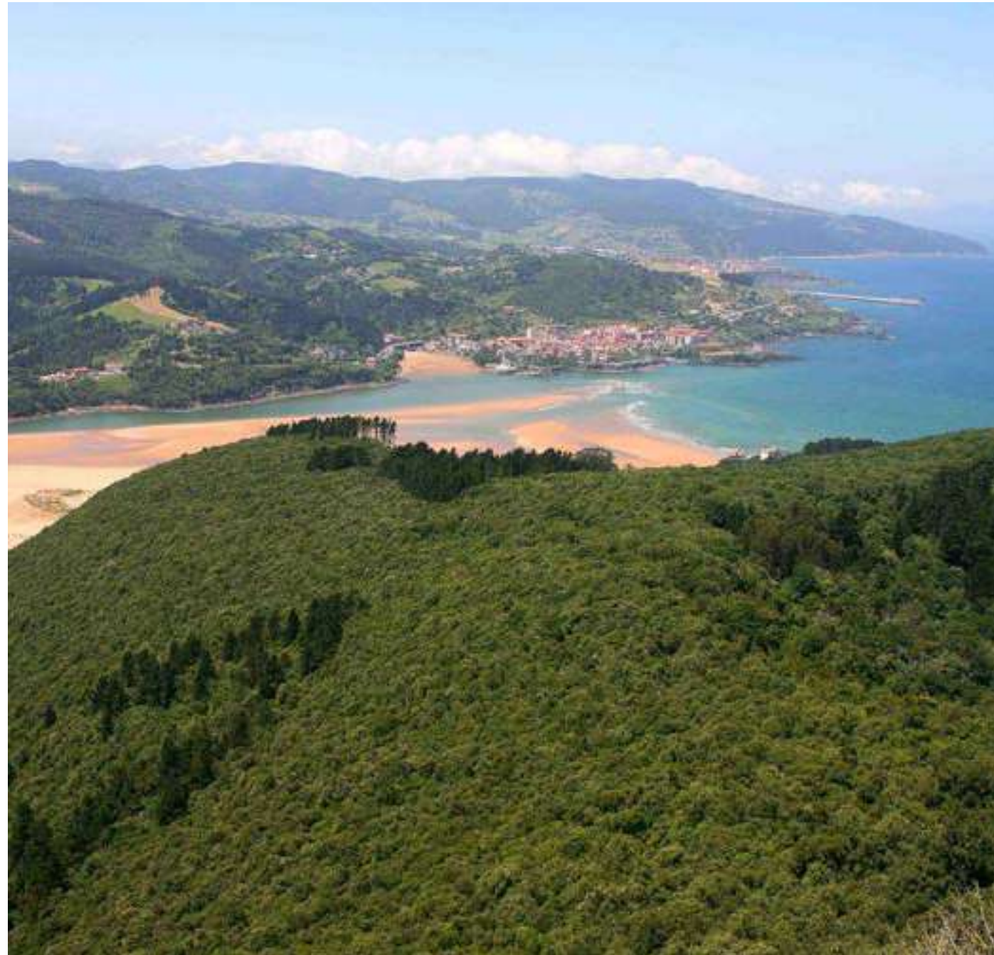
Monte Atzarre, Ibarrangelu.

Los Montes de Utilidad Pública (MUP) son propiedad de los municipios y están gestionados por la Diputación Foral de Bizkaia, se denominan así por los importantes beneficios ambientales y sociales que aportan. Se puede decir que son la versión actual de los montes comunales, que existían ya en la Edad Media, y también eran propiedad de los municipios. Los vecinos y vecinas podían utilizarlos para su aprovechamiento. Compartían su explotación porque eran montes "de todos". Tenían la obligación de limpiarlos para evitar fuegos, y estaba reglada la cantidad de leña que cada cual podía obtener de los mismos. Los montes comunales eran nu-