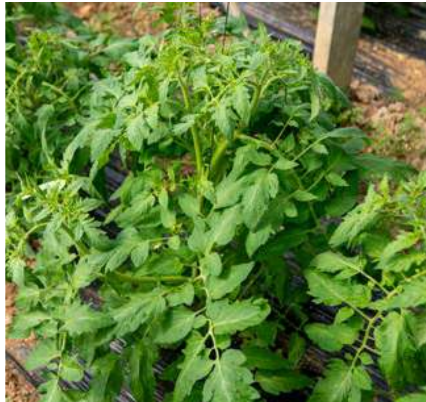
Planta de tomate.