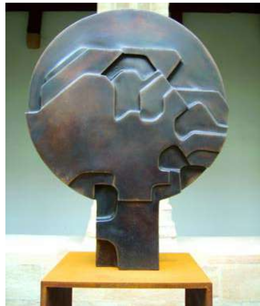
Escultura Hilarriak , en el claustro de la Franciscanos de Bermeo

Una de sus singularidades es la amplitud y profundidad de su trabajo en distintos ámbitos artísticos