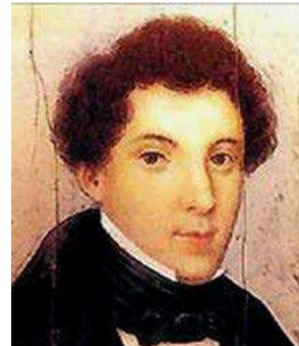
Juan Crisostomo de Arriaga