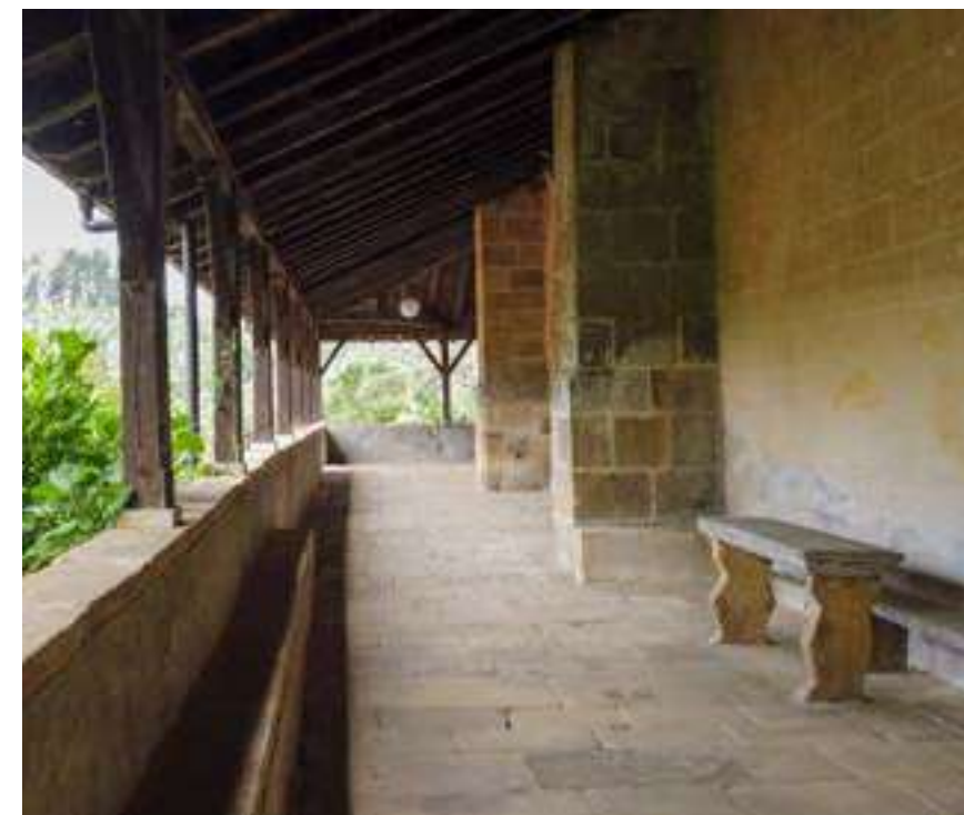
Txopitel-harria del pórtico de la Iglesia Santo Tomás, Arratzu

1550. A esta momia natural se le atribuye el don de curar la tartamudez. Como abrir y cerrar el féretro, cada vez que lo pedían para besar o tocarlo y pedirle el milagro, se hacía complicado, le cortaron una mano y la colocaron en una especie de guante de metal. Esa mano es hoy toda una reliquia, hasta el punto de haber formado parte recientemente (enero 2024) de los cincuenta objetos de la exposición 'Sorolla y las reliquias', del Museo de Arte Sacro de Bilbao. Si el día de San Antonio acudes a la misa podrás pedirle a la momia que obre el milagro. UM