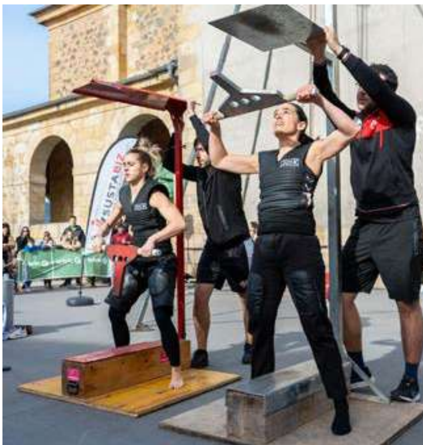
Exhibición de levantamiento de yunque .

Sustabiz Fundazioa tiene 22 mujeres entrenando, con inmejorables resultados. Hemos abierto las puertas del deporte rural a todo el mundo