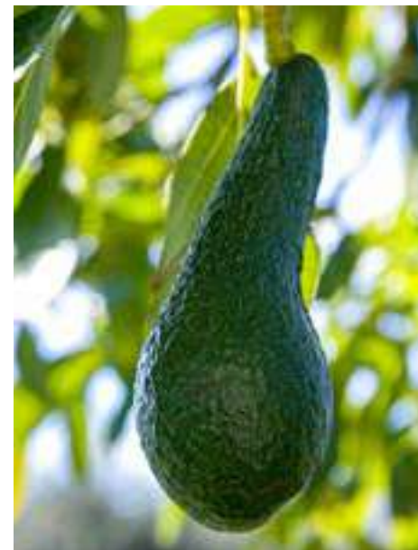
Aguacate de la variedad "Fuerte"

También en Forua encontramos una familia que probó suerte con el aguacate y ahora asegura estar encantada. "Lo plantamos hace 10-12 años porque escuchábamos en la radio que se podía plantar en casa, estaba muy de moda. Cogimos