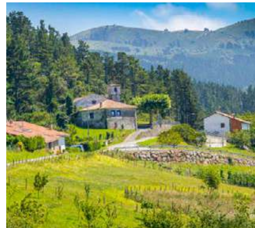
Camino a Gabika.

Ereño ofrece excelentes posibilidades para hacer senderismo, disfrutar de un día tranquilo con aperitivo o comida incluida, en Elexalde o Atxoste y para realizar visitas culturales a su patrimonio. El castillo y necrópolis de Ereñozar, la antigua cantera o la exposición Sintonía Arrecifal, se complementan con un excelente circuito ecuestre, la ruta IE-042, de 34 km. que parte del barrio de Gabika. Un circuito circular en muy buen estado, homologado y bien señalizado que también resulta de lo más recomendable para seguir a pie en alguno de sus tramos entre Ereño y Nabarniz.