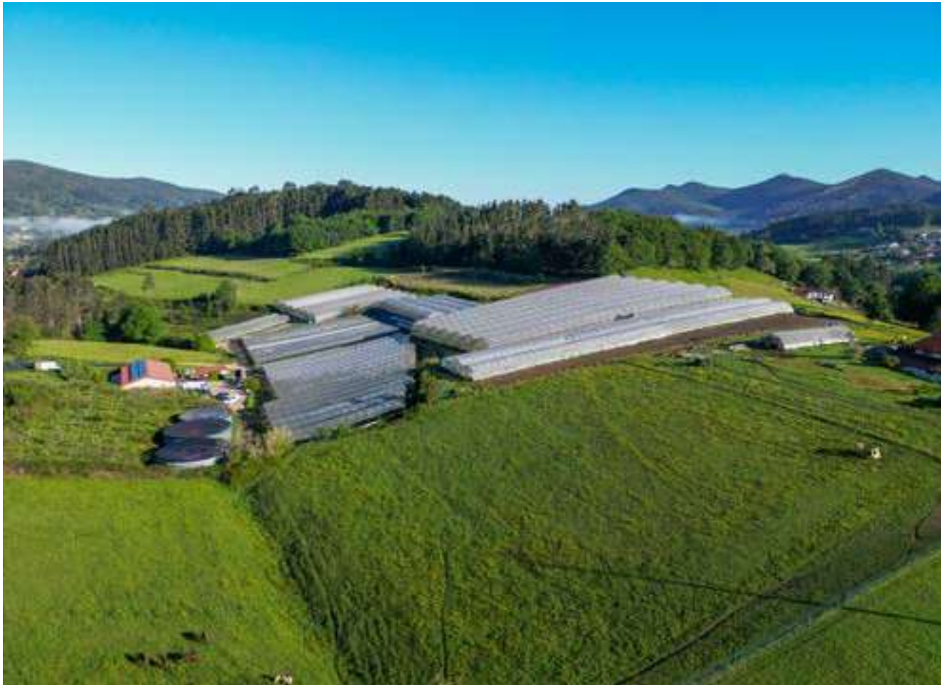
Imagen aérea del terreno de Lapikote Baserria.

Que me pidan lo que me tengan que pedir pero que no traigan tomate de Bélgica.