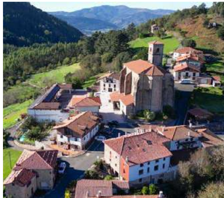
Núcleo principal de Ereño, con la Iglesia San Miguel presidiendo el barrio Elexalde.

La pequeña sierra que protege Ereño por el norte, es otra excelente opción para excursiones y caminatas. Si nos asomamos a la zona más alta del cordal, la montaña nos ofrece, por sorpresa, unas magníficas vistas de la costa desde Naxitua y Lekeitio hasta Getaria y Jaizkibel.