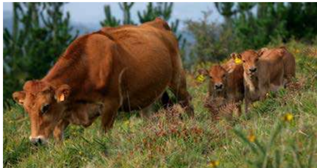
Vacas en los pastos comunales de Illunzar, Nabarniz.